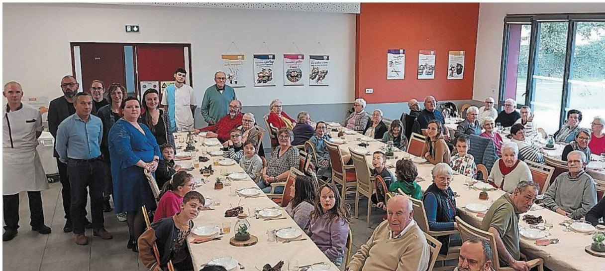
Un repas partagé entre les générations, jeunes et moins jeunes, était organisé lundi 28 octobre.